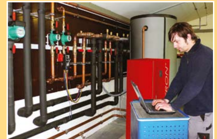
Jede SIMAKA -Wärmepumpe wird im Werk umfassend geprüft und voreingestellt.

Unsere Pumpen haben nicht nur innere Werte, sondern wurden auch so designed, dass sie auf kleinstem Raum Platz finden. D.h. Sie können Ihre SIMAKA -Pumpe auch in der Abstellkammer unterbringen. Dank ihres leisen Geräuschverhaltens ist sie ohne Probleme in der Nähe des Wohnbereichs zu integrieren.