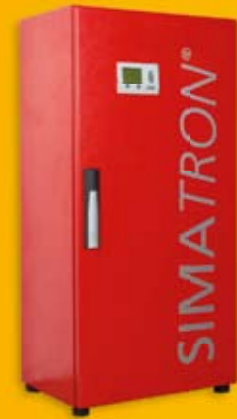
SIMATRON® WP 2,5 - 20