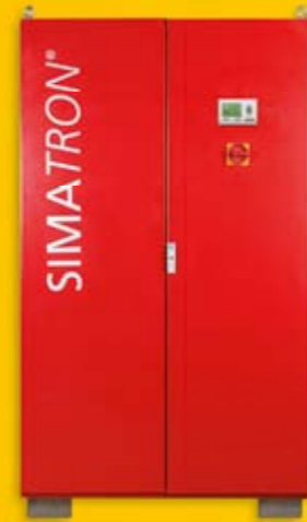
SIMATRON® WP 62 - 372