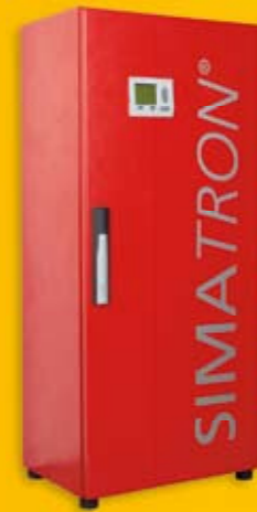
SIMATRON® WP 21 - 61